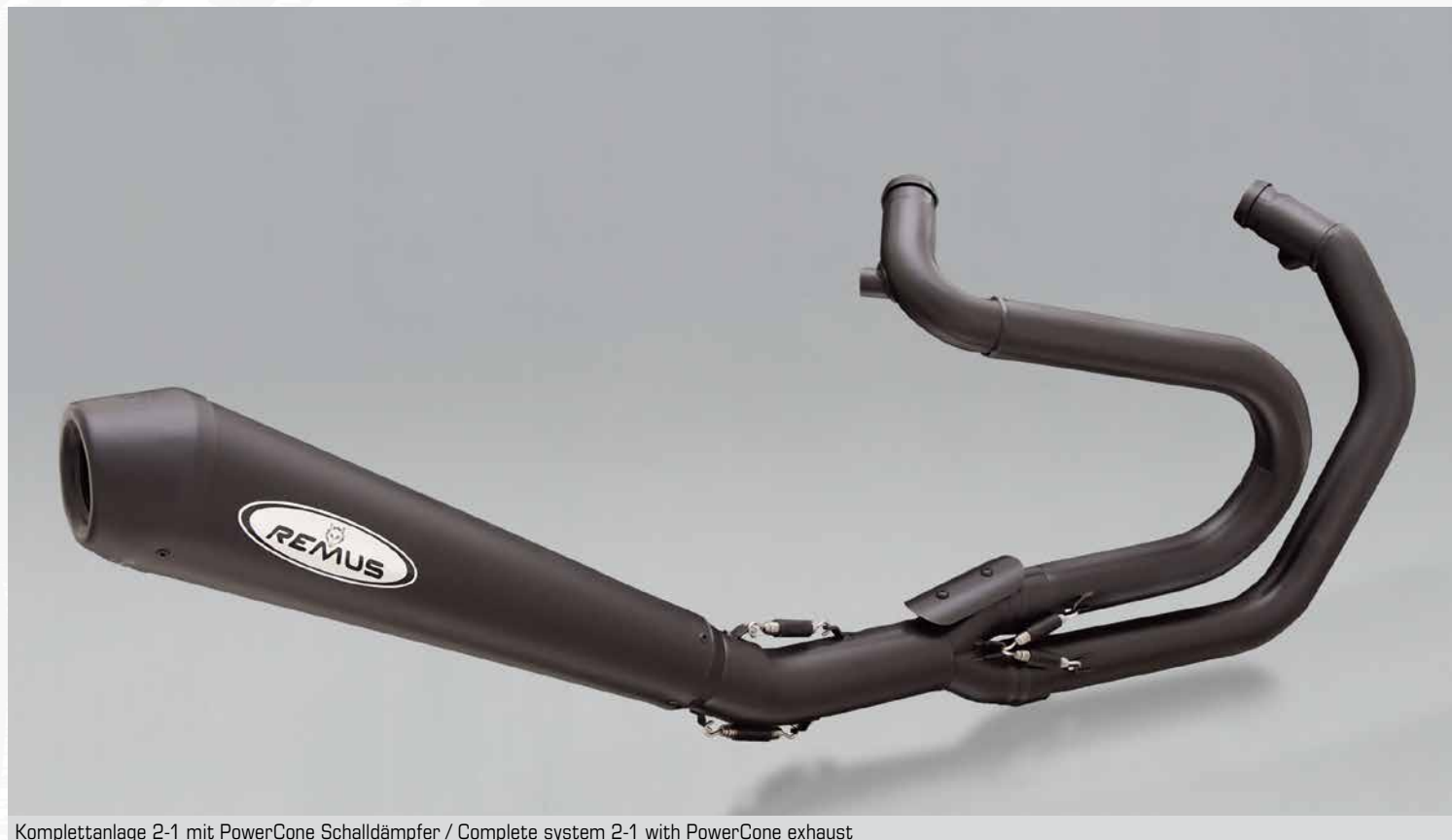
Kompletanlage 2-1 mit PowerCone Schalldämpfer / Complete system 2-1 with PowerCone exhaust