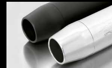
EK82 / EK12 - TAPERED