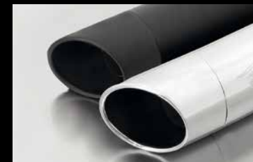
EK80 / EK10 - SLASH CUT

Wählen Sie aus 6 unterschiedlichen Designs / Choose between 6 different end caps