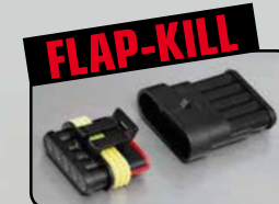
Deaktivierungsstecker für Serienklappe / deactivating plug for serial valve (RACING - no EG/ABE/EEC)