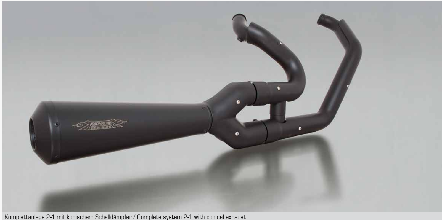
Kompletanlage 2-1 mit konischem Schalldämpfer / Complete system 2-1 with conical exhaust

(mit EG Genehmigung / with EC homologation)