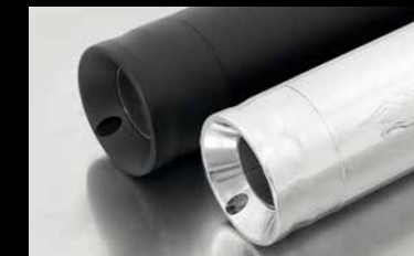
EK81 / EK11 - STRAIGHT END