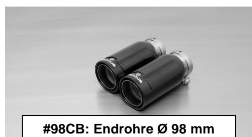
#98CB: Endrohre Ø 98 mm Street Race Black Chrome