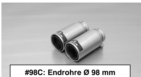
#98C: Endrohre Ø 98 mm Street Race, poliert