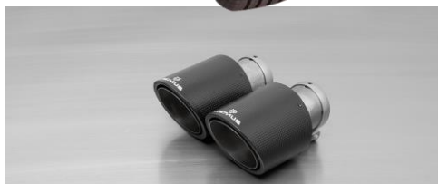
#70CSS: Carbon-Endrohre Ø 102 mm schräg/schräg, Innenaufbau Titan