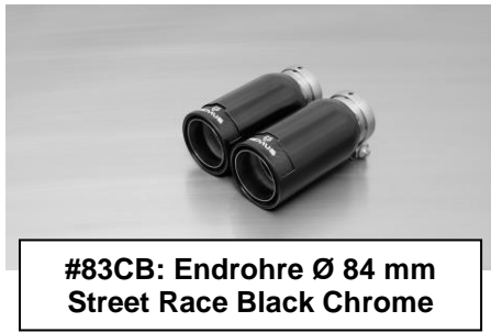
#83CB: Endrohre Ø 84 mm Street Race Black Chrome