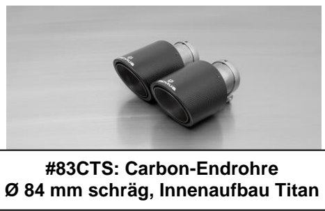
#83CTS: Carbon-Endrohre Ø 84 mm schräg, Innenaufbau Titan