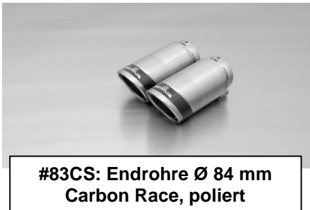
#83CS: Endrohre Ø 84 mm Carbon Race, poliert