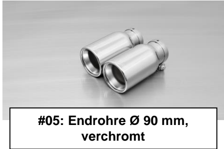
#05: Endrohre Ø 90 mm, verchromt