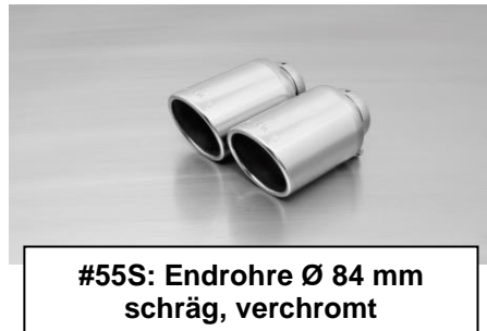
#55S: Endrohre Ø 84 mm schräg, verchromt