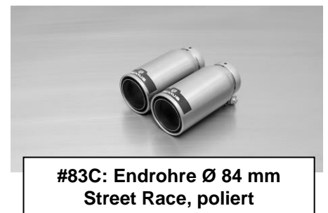
#83C: Endrohre Ø 84 mm Street Race, poliert