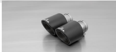
#70CS: Carbon-Endrohr Ø 102 mm schräg, Innenaufbau Titan