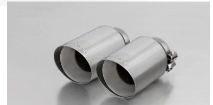
#70SG: Endrohr Ø 102 mm schräg, straight cut, verchromt