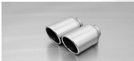
#70S: Endrohr Ø 102 mm schräg, verchromt