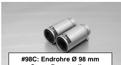
#98C: Endrohre Ø 98 mm Street Race, poliert