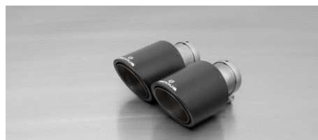
#70CS: Carbon-Endrohr Ø 102 mm schräg, Innenaufbau Titan