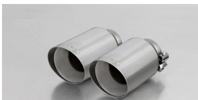
#70SG: Endrohr Ø 102 mm schräg, straight cut, verchromt