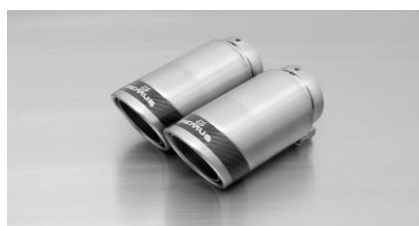
#83CS: Endrohre Ø 84 mm Carbon Race, poliert