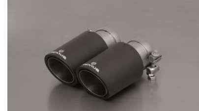
#83CTS: Carbon-Endrohre Ø 84 mm schräg, Innenaufbau Titan