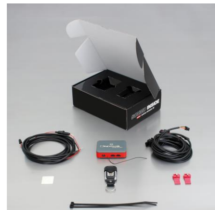
STE 0004 für Links/Rechts-Anlage