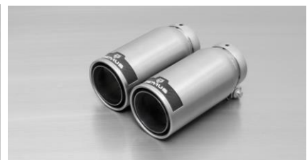
#83C: Endrohre Ø 84 mm Street Race, poliert