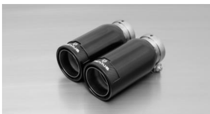
#83CB: Endrohre Ø 84 mm Street Race Black Chrome