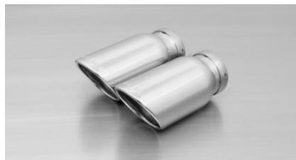
#55S: Endrohre Ø 84 mm schräg, verchromt