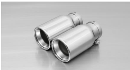
#05: Endrohre Ø 90 mm, verchromt