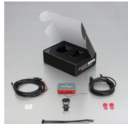
STE 0003 für einseitige Anlage (Links ODER Rechts)