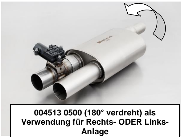
004513 0500 (180° verdreht) als Verwendung für Rechts- ODER Links- Anlage