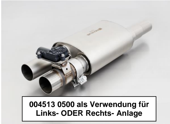
004513 0500 als Verwendung für Links- ODER Rechts- Anlage