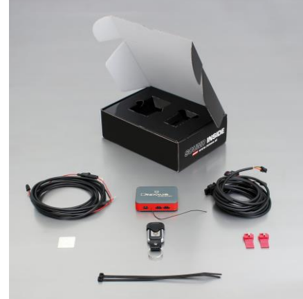
STE 0004 für Links/Rechts-Anlage